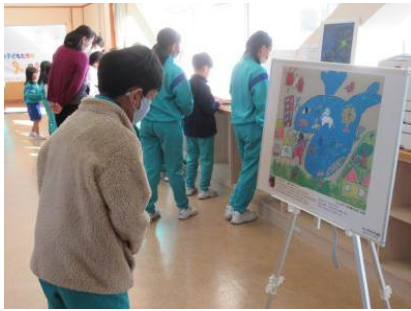
【小児がんの子供たちの絵画】