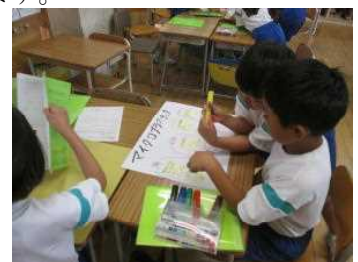
【4年生 総合的な学習】

2年生の説明文の学習では、「たんぼぼ図鑑」を完成させ、家族にたんぼぼの賢さを伝えたいと意欲的に学習に取り組んでいました。6年生の理科では、唾液と消化の関係を各自が実験を通して明らかにしていました。4年生の総合的な学習では、ごみ問題を調べる中で自分が調べたこと、家の方から聞き取ったこと等をカードに書き、紹介し合う子供たちがとても嬉しそうでした。そして、そのカードを仲間分けしたり、感想を言い合ったりして学びを深めていました。